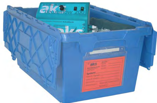
aks-Hygiene- und Transportbox für den geschlossenen Hygienekreislauf